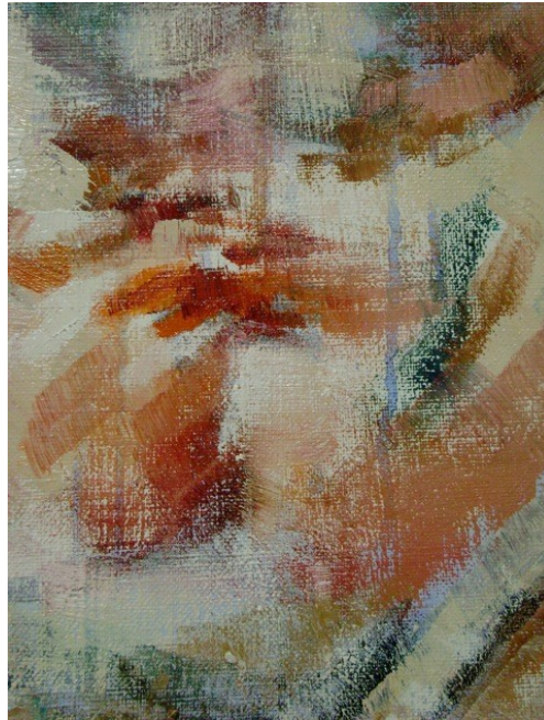
© : Agnès Mariller, TENIR (détail) 2010

Titre : le titre se donne, arrive en même temps que l'image est conçue. Si le titre ne s'est pas précisé de lui-même, en amont de la toile, bien avant sa réalisation, alors celle-ci restera non-nommée.