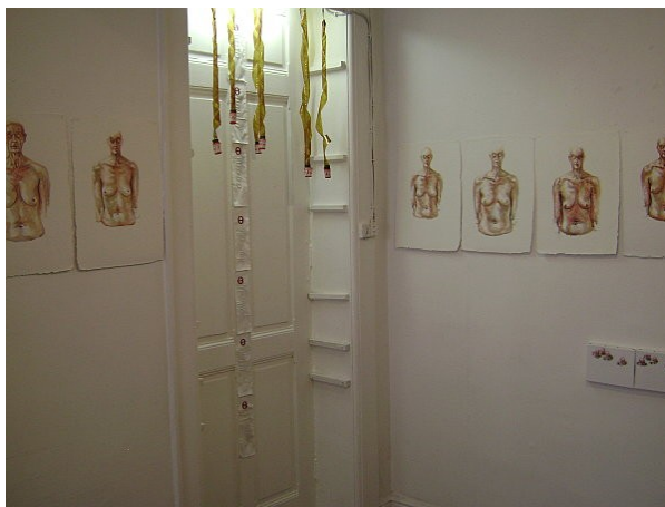
© : Agnès Mariller, « LES ENGLUEES », Installation : litanie de sept mots brodés sur soie, sept aquarelles et sept huiles sur toile, 2010

J'ai peur que détruire ne me montre une incapacité absolue et définitive de peindre : je retravaille ou détruis mais quand du temps s'est écoulé, longtemps après.