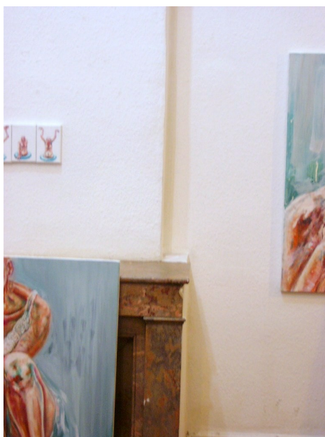
©: Isabelle Bernard/Artothèque Idéographe, « Atelier Agnès Mariller »

Le corps devient un médium, vraiment dans le sens de ce passage entre intériorité et extériorité, un catalyseur d'une « sensation du monde ». Avec la représentation du corps, j'affirme une présence au monde. Étant mon propre modèle, outre l'aspect performatif de poser et de peindre à la fois, la répétition ad nauseam jusqu'au dégoût de cette représentation efface toute personnalité : la figure devient un sujet lambda, un quidam, exemple d'humanité. C'est pourquoi je refuse totalement la notion d'autoportrait.